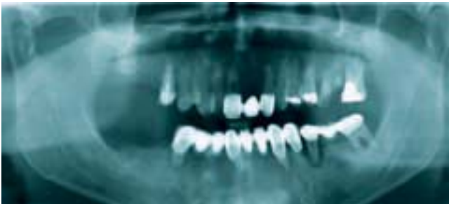
Abbildung 1 Festsitzender Zahnersatz aus dem Ausland (Brücke 21-23; 37-35; 34,33-41-44)