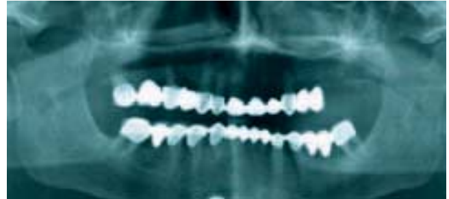
Abbildung 2 Festsitzende Versorgung im Ober- und Unterkiefer mit zwei Freigliedern in regio 24,25 und fraglicher Indikation für festsitzende Versorgung.

lung der befundbezogenen Festzuschüsse vornehmen, wenn im Vorfeld ein in Deutschland gutachterlich überprüfter Heil- und Kostenplan die medizinische Notwendigkeit bestätigt hat, lässt ein Großteil der Krankenkassen den ausländischen Zahnersatz im Nachhinein gutachterlich überprüfen. Hierbei stehen Fragen nach der medizinischen Notwendigkeit entsprechend den Richtlinien des Gemeinsamen Bundesausschusses und hinsichtlich der technischen Ausführung und möglicher Mängel im Vordergrund. Grundsätzlich beträgt der Zuschuss für ausländischen Zahnersatz höchstens den Betrag, den der Versicherte auch für seine prothetische Versorgung in Deutschland erhalten hätte (abzüglich Abzüge für Verwaltungskosten, fehlende Wirtschaftlichkeitsprüfung und Praxisgebühr). Maximal darf nur der Betrag der tatsächlich entstandenen Kosten erstattet werden. EU-weit gilt ebenfalls eine „Garantie“ für Zahnersatz von zwei Jahren [4].