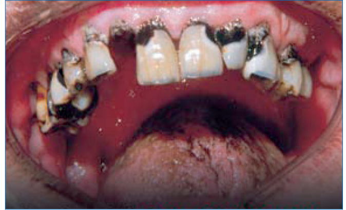
Beispiel für Erkrankungen der Mundhöhle: Parodontitis, Zahnkaries, Zahnverlust und Zungenverfärbungen.

Eine schwere Parodontalerkrankung betrifft in Deutschland etwa 20 Prozent der erwachsenen Bevölkerung 29 . Verbreitung und Schwere der Erkrankung kann somit für Deutschland als hoch eingeschätzt werden. Bei dieser entzündlichen Erkrankung des Zahnhalteapparates (Parodontitis) werden nach und nach bindegewebige und knöcherne Strukturen, die den Zahn im Kiefer festhalten, abgebaut, bis sich die Zähne lockern und unbehandelt letztendlich ausfallen. Dieser chronisch verlaufende Abbau des Zahnhalteapparates beginnt im mittleren Alter, sodass die schweren Formen mit starkem Abbau des Knochens und dem Verlust von Zähnen bei Menschen höheren Alters auftreten 23,30 .